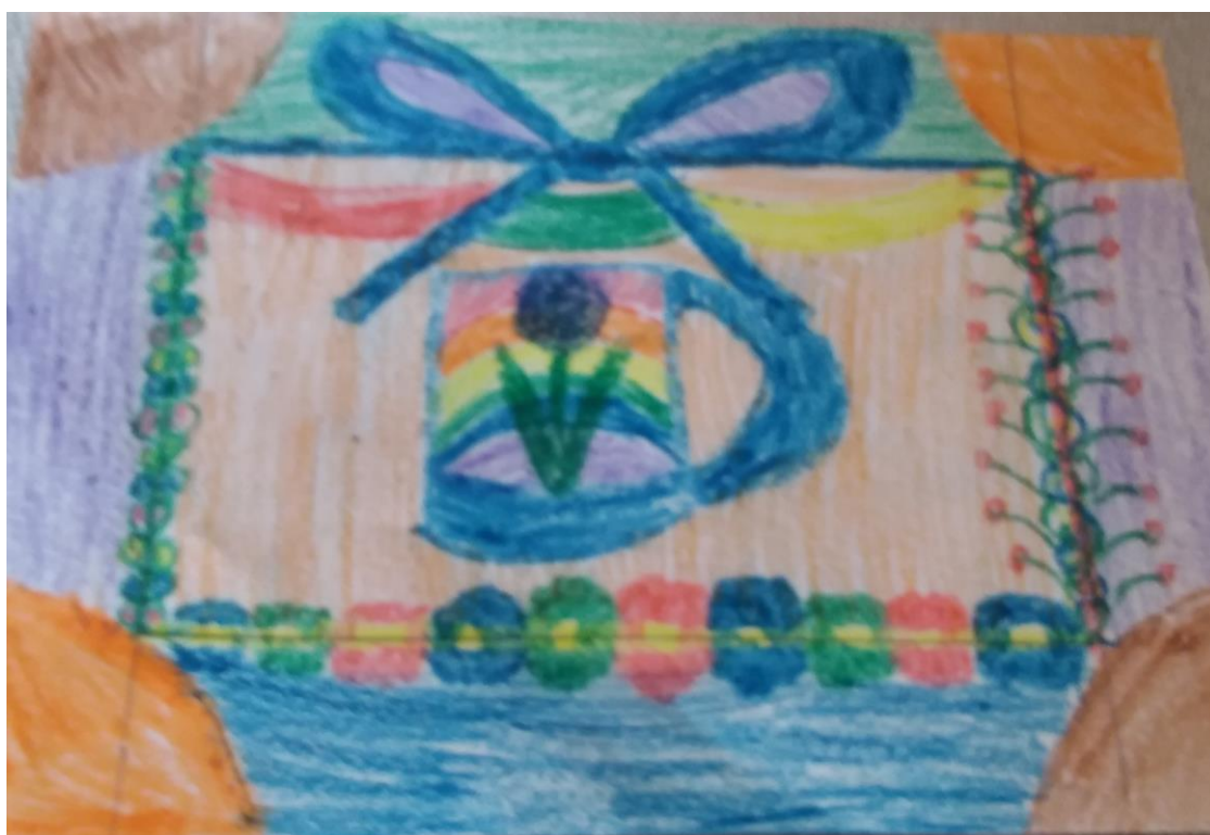
Piotr Duława kl. VIa