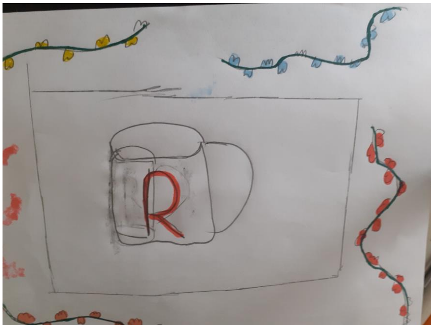
Rafaela Król kl. VIb